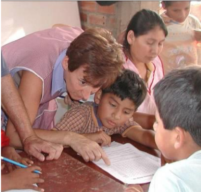
Las líneas y la vista que guían

Es genial cuando se puede utilizar una combinación de varios conceptos.