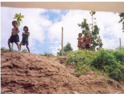
Encuádralos en el ambiente