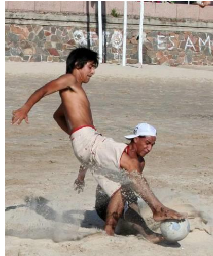
Capturando la acción