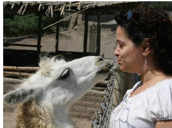
Estado de ánimo